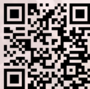
Libro de Trabajo para Jóvenes