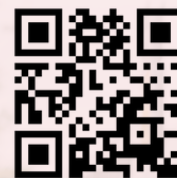
Toma de Decisiones con Apoyo